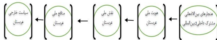
نمودار ۱- مدل سیاست خارجی عربستان برگرفته از مدل کلی سیاست خارجی دکتر دهقانی فیروزآبادی

این نظریه یکی از نظریه‌های مهم روابط بین‌الملل است که در آن تلاش می‌شود مسائل عمده سیاست بین‌الملل از جمله سیاست خارجی کشورها بررسی شود. در این مقاله به بررسی سیاست خارجی عربستان در قالب دیپلماسی عمومی پرداخته شده است. این کشور در صدد است تا با برقراری روابط دیپلماتیک با دیگر کشورها به منافع ملی خود دست یابد که رسیدن به منافع ملی باعث تحقق سیاست خارجی آن می‌شود و برای این کار از هویت و فرهنگ خود استفاده می‌کند.