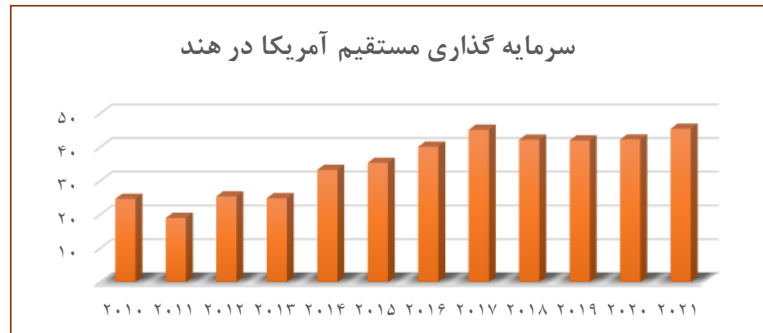
نمودار ۱- سرمایه‌گذاری مستقیم آمریکا در هند از ۲۰۱۰-۲۰۲۱

منبع گردآوری شده توسط نویسندگان از: Statista (b), (2021)