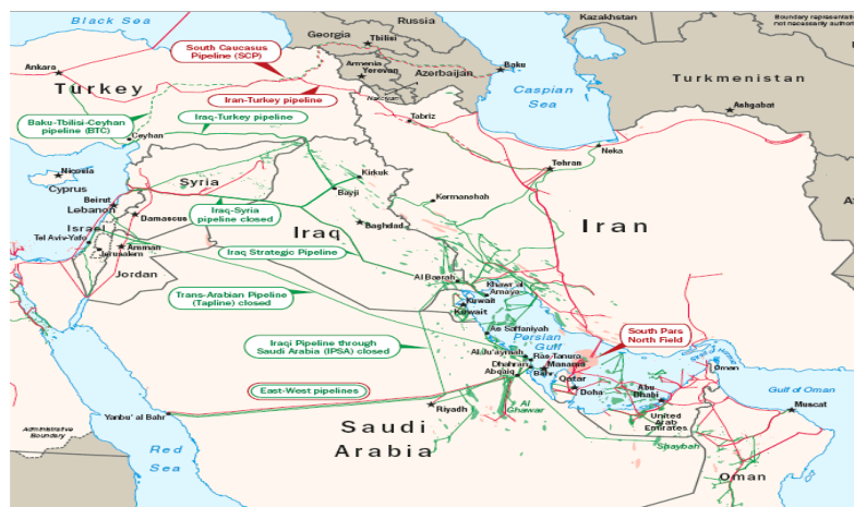
شکل ۲: نقشه ذخایر نفت و گاز خلیج فارس