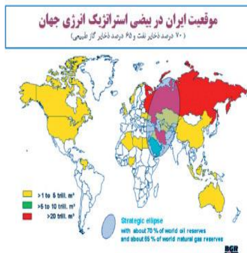
شکل ۳: بیضی استراتژیک انرژی

عمر ذخایر گاز ایران با توجه به سطح فعلی تولید آن حدود ۱۷۹ سال برآورد شده است؛ این در حالی است که عمر ذخایر گازی دنیا به طور متوسط ۶۵ سال است (ترازنامه انرژی، ۱۳۸۳: ۱۷۶). ایران با داشتن ۲۸/۱۲ تریلیون متر مکعب که ۱۵/۵ درصد ذخایر شناخته شده گاز جهان را در بر می‌گیرد، از این نظر در جایگاه دوم جهان است. همچنین، ایران از نظر جغرافیایی دارای موقعیت ارتباطی راهبردی برای انتقال نفت و گاز دو حوزه بزرگ انرژی یعنی خلیج فارس و دریای خزر است. نگاهی به شکل ۳، موقعیت استراتژیک جدی ایران را در قلب این کانون حساس جهانی آشکار می‌سازد. روی این اصل است که صاحب نظران حوزه مسائل استراتژیک با اذعان به تغییر مکان هارتلند ژئواستراتژیک قرن بیستم بر این باورند که ایران تبدیل به هارتلند انرژی جهان در سده بیست و یکم شده است (مجتهدزاده، ۱۳۸۹: ۱۷۵).